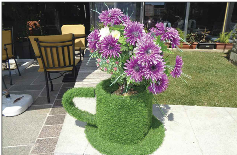
Όμορφες, ανοιξιάτικες εικόνες από την κεντρική πλατεία της Καρδίτσας!!!